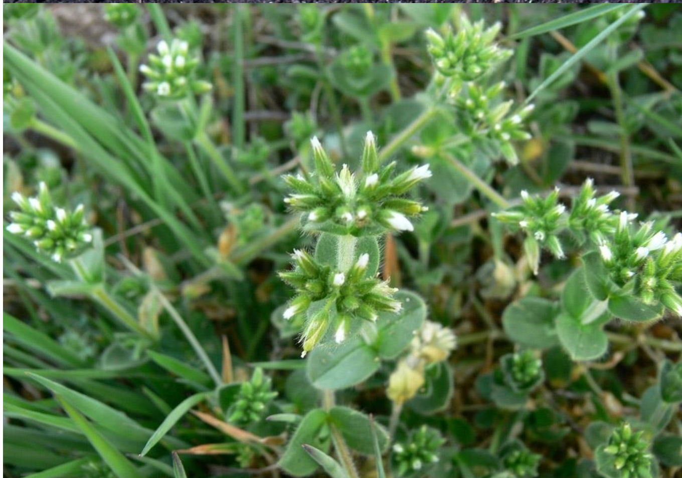
Oreja de ratón