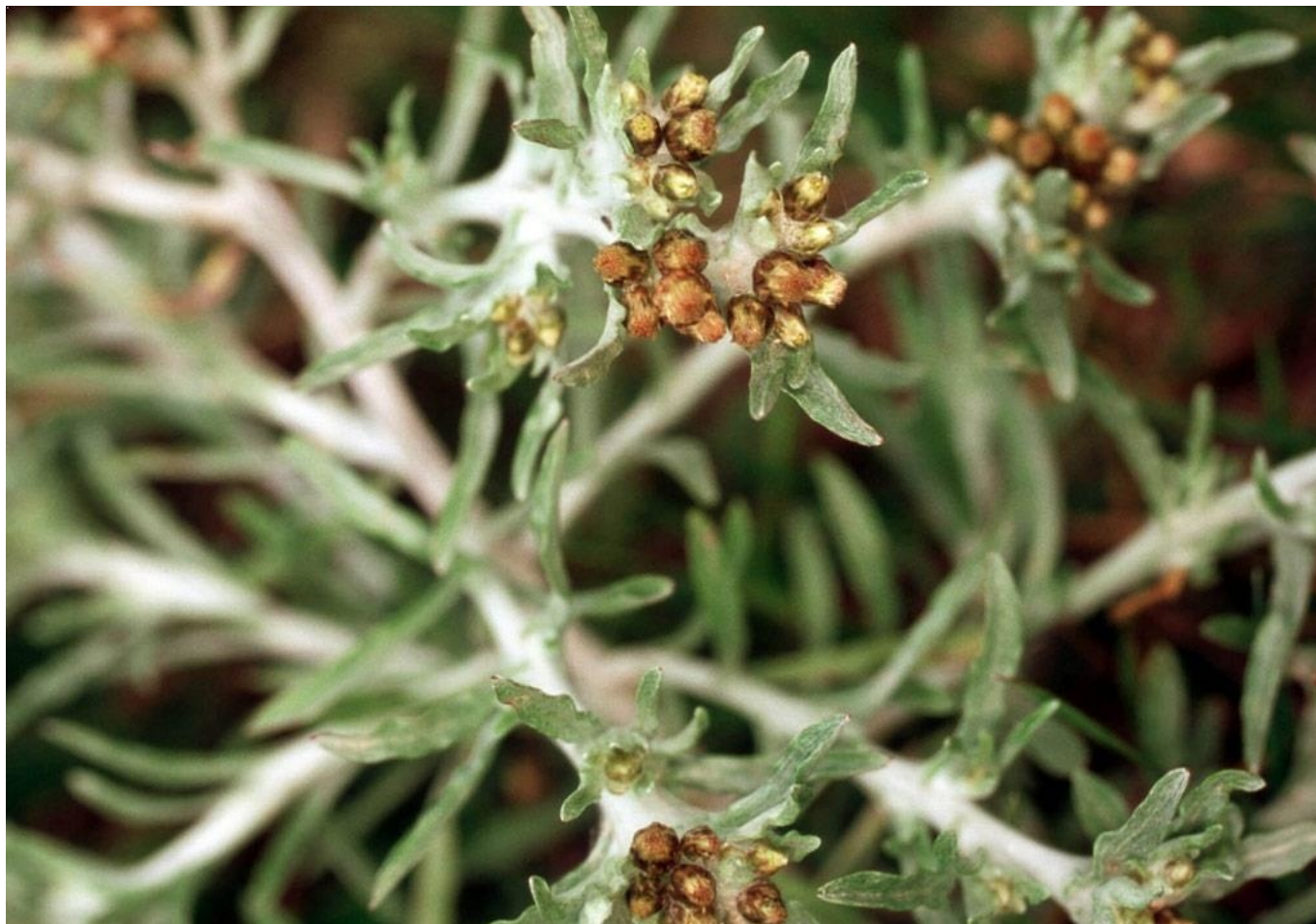
Pie de gato