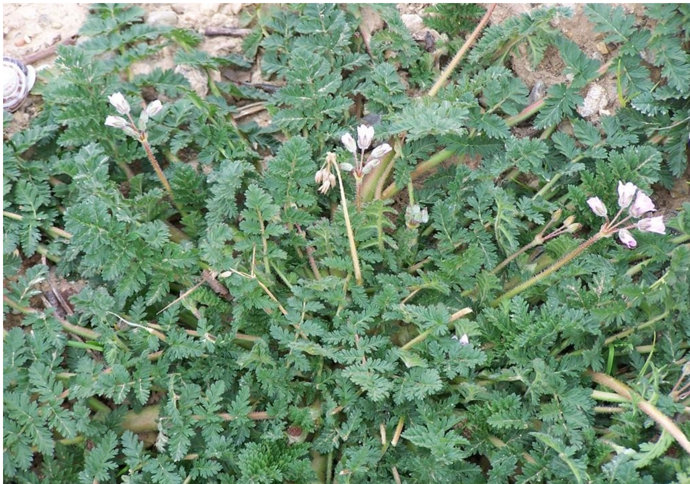
Alfiler de pastor