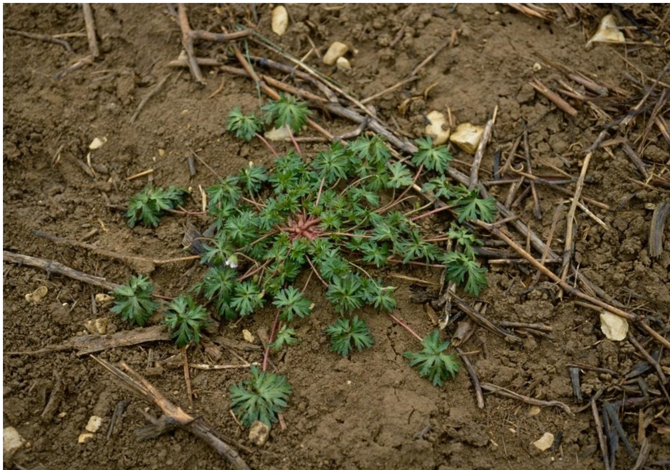
Geranio de hoja cortada