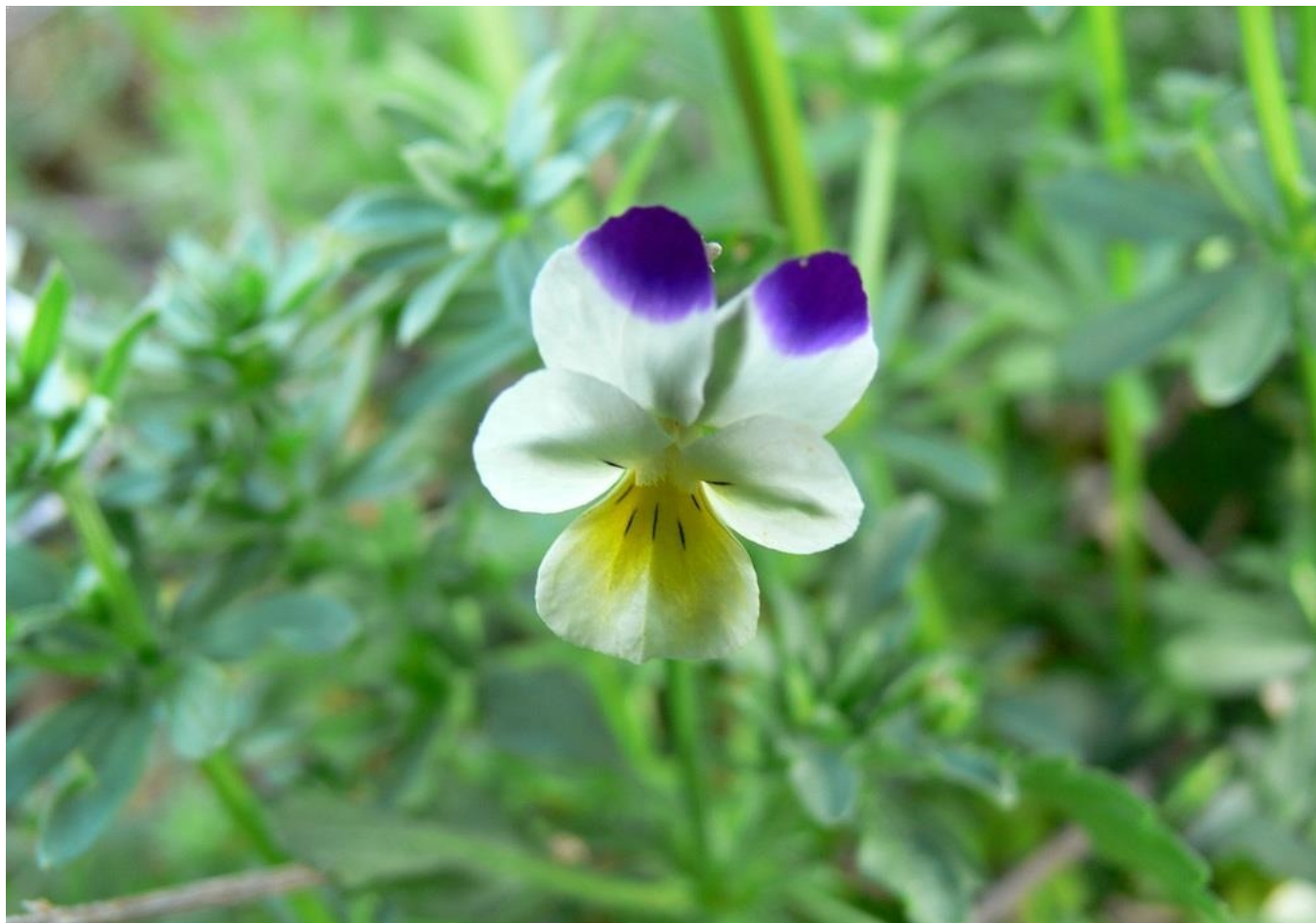
Violeta de los campos