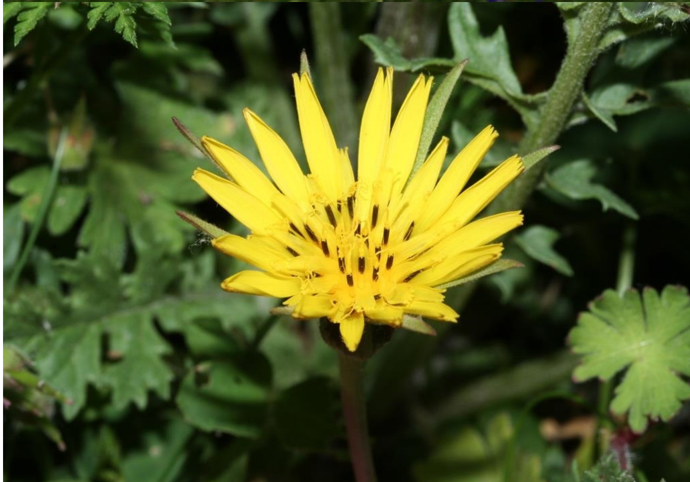
Barba de cabra