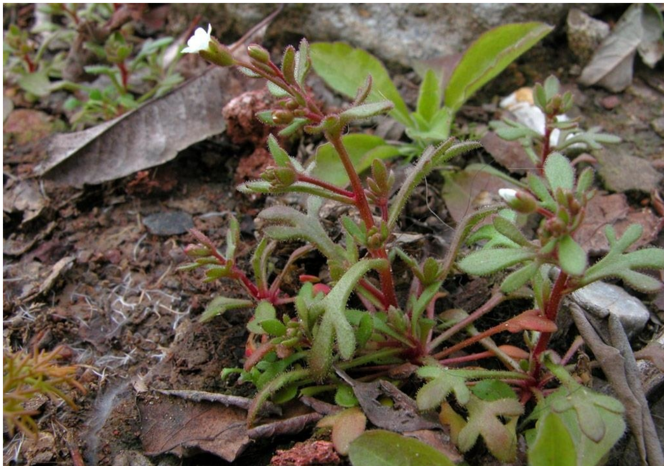
Saxifraga de tres dedos