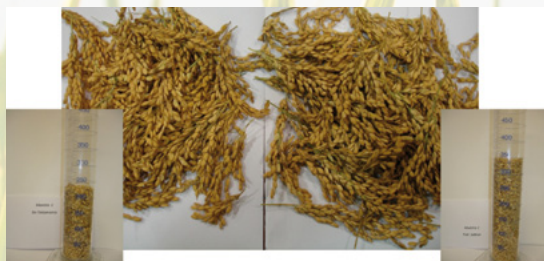
Muestra 2, sin Isabión