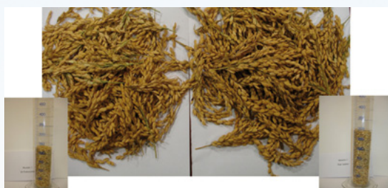
Muestra 1, sin Isabión